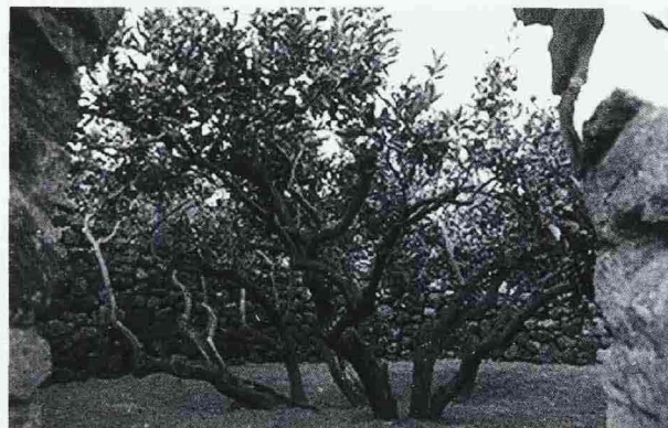
All'interno del giardino un'unica pianta secolare di arancio dolce della varietà Portogallo si sviluppa su più tronchi fino ad occupare tutto l'area disponibile.

www.donnafugata.it ; www.fondoambiente.it .