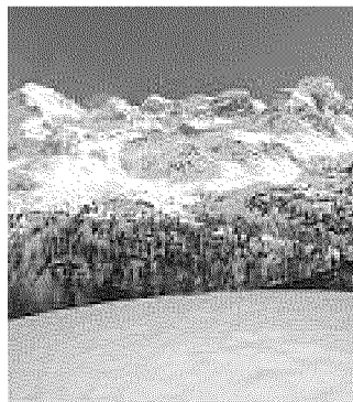
Veduta dei monti di Val Martello

VAL MARTELLO (BZ). Natale Il mercatino più alto d'Europa a 2000 metri