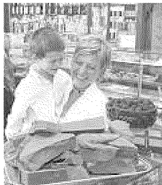
Un negozio di cioccolato a Torino

TORINO. Per tutto l'inverno A caccia di cioccolato Svizzero? No, torinese